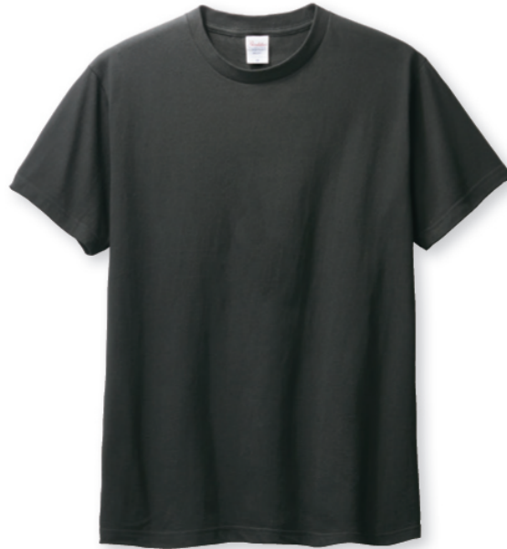
223 スモークブラック